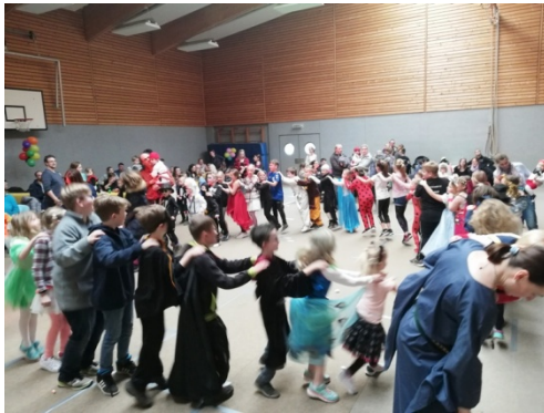
Kinderfasching im Februar