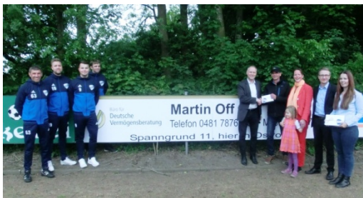
Ein neuer Sponsor für die Bandenwerbung auf dem Sportplatz