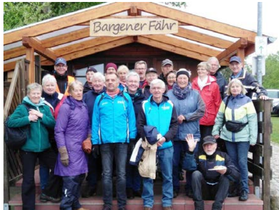
Fahrradtour am 1. Mai