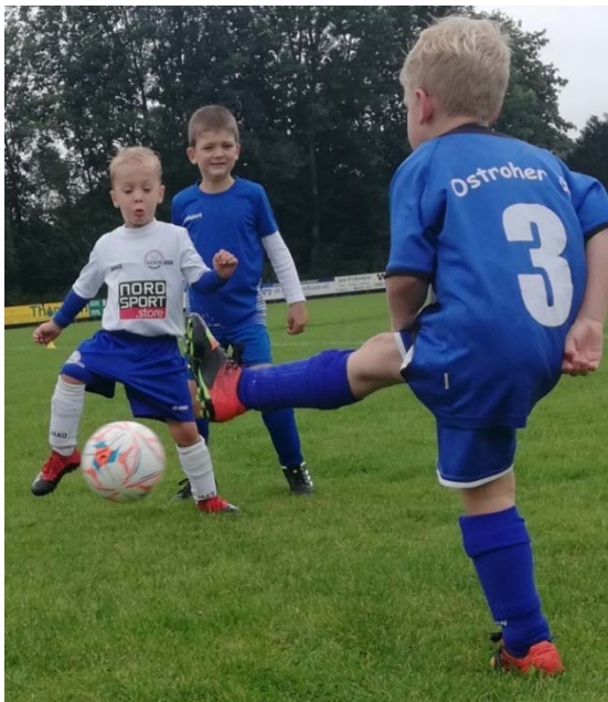
Die G Jugend des Ostroher SC in Aktion