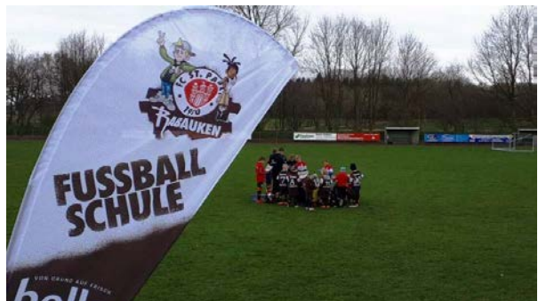
Rabaukencamp des FC St. Paulis in den Osterferien