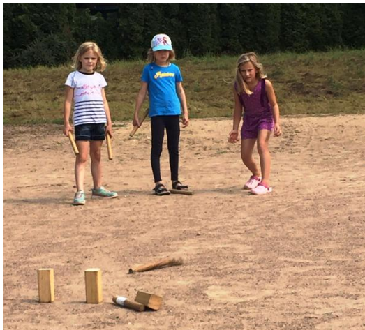
Wikingerschach-Turnier in den Sommerferien