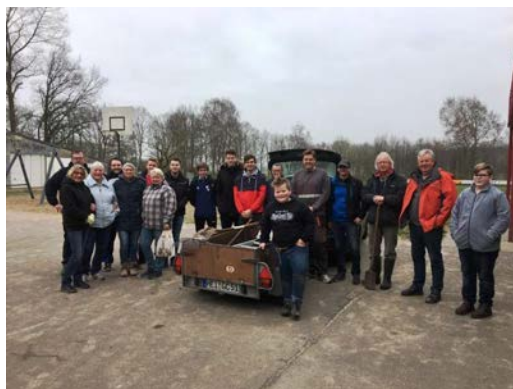
Frühjahrsputz „Gemeinsam sauber“