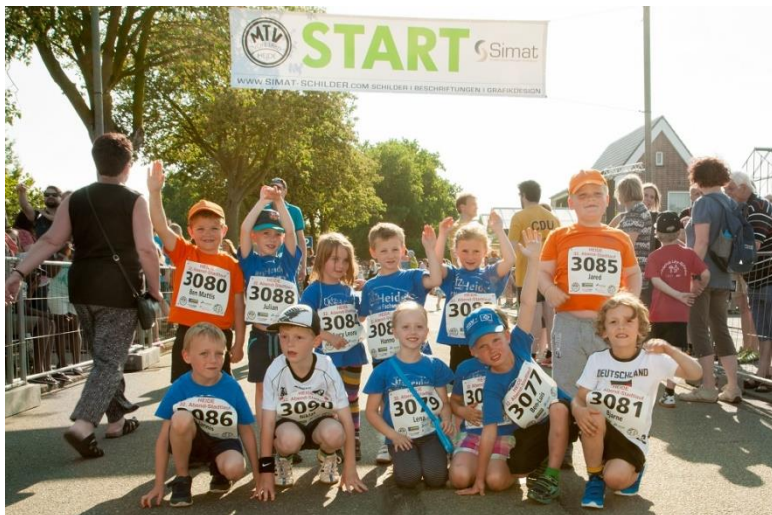
Wichtellauf beim Heider Stadtlauf 2016

aber die haben wir nicht dabei. Alle, ohne Ausnahme, haben mitgemacht und die Geräte ausprobiert.