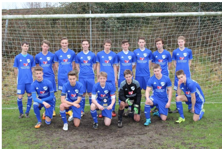
Unsere A-Jugend in der SH-Liga