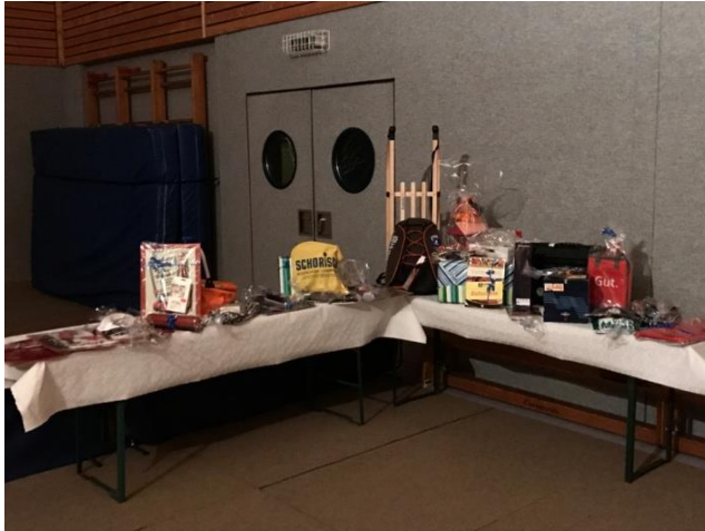
Tombola & Verkaufsstand Weihnachtsfeier