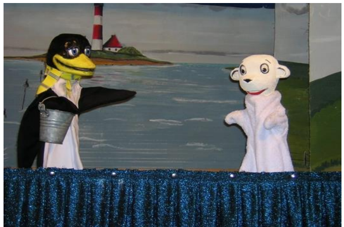
Walter Krefl's Puppenbühne