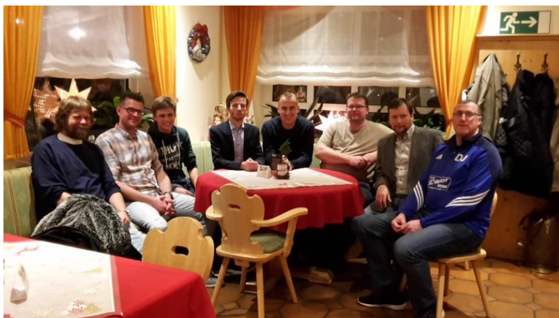
Die erfolgreiche Jugendfußballsparte