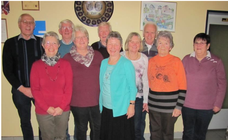
Mitglieder „Fit für Jedermann“